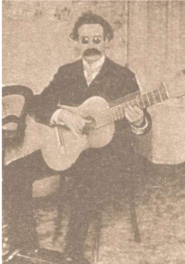
Semanario Caras y caretas de Buenos Aires (1902)